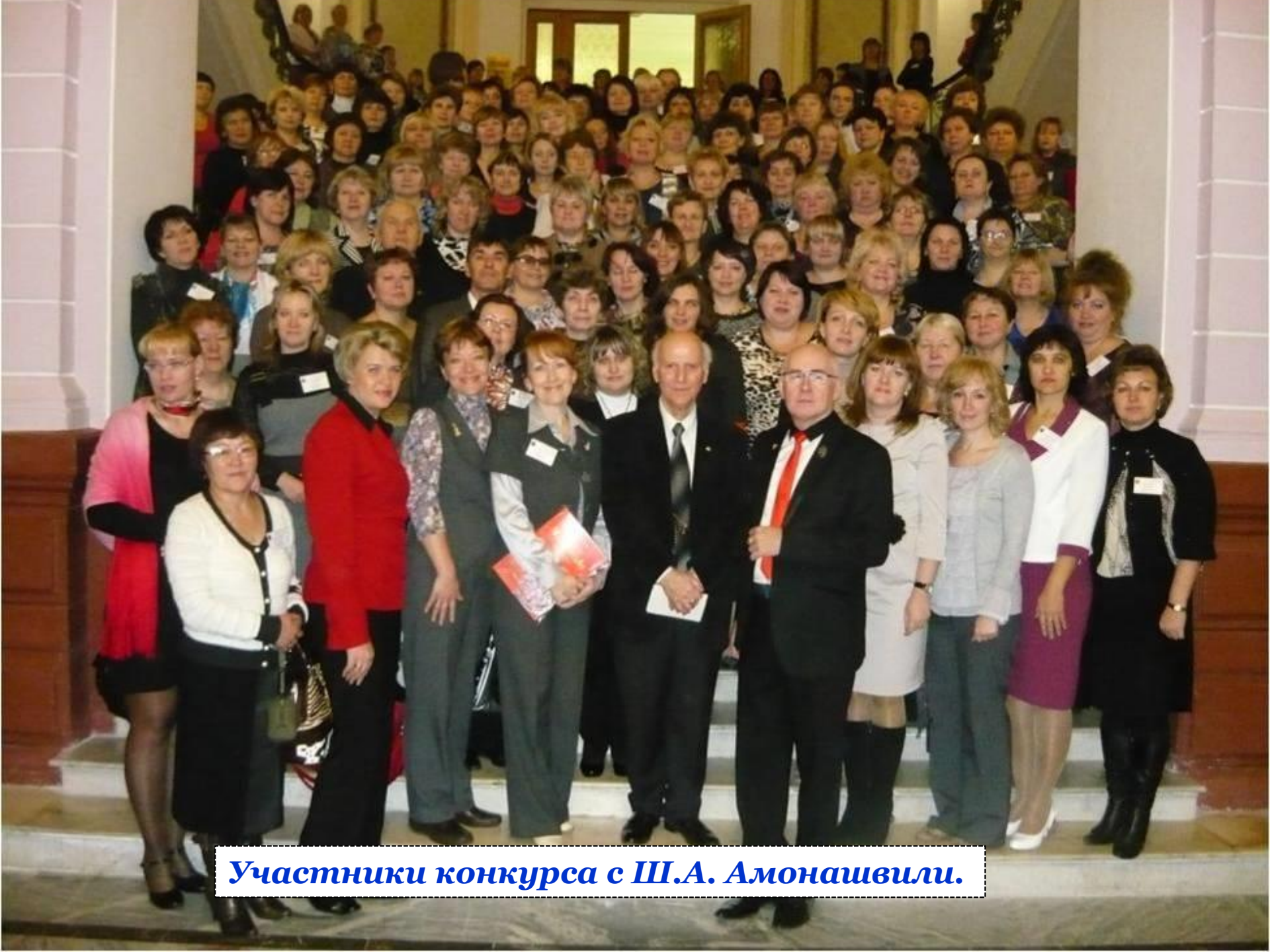
Участники конкурса с Ш.А. Амонашвили.